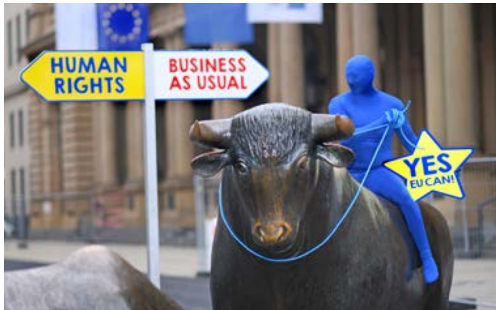
SÜDWIND-Aktion für menschenrechtliche Pflichten für den Finanzsektor im EU-Lieferkettengesetz vor der Frankfurter Börse.

Der Kompromiss zum EU-Lieferkettengesetz sieht vor, dass Finanzakteure zwar unter die Regulierung fallen, aber nur in ihren vorgelagerten Lieferketten, also z.B. bei der Beschaffung ihrer Büromöbel. Nicht erfasst werden aber die für die Achtung der Menschenrechte wirklich wichtigen Finanzgeschäfte. Dasselbe gilt auch für das deutsche Lieferkettensorgfaltspflichtengesetz.